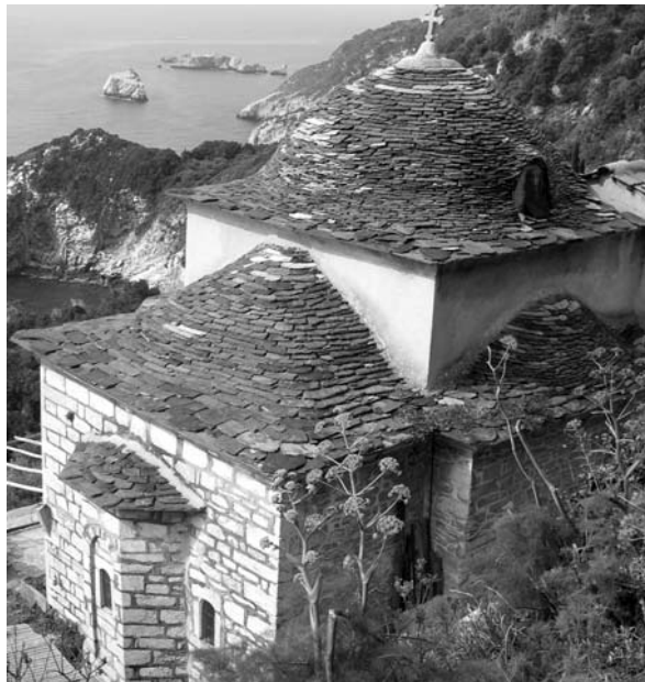
Εἰκ. 3. Παρεκκλήσι Ἁγίου Ἰωάννου τοῦ Θεολόγου. Ἐξωτερικὴ ἄποψη ἀπὸ ΒΑ.