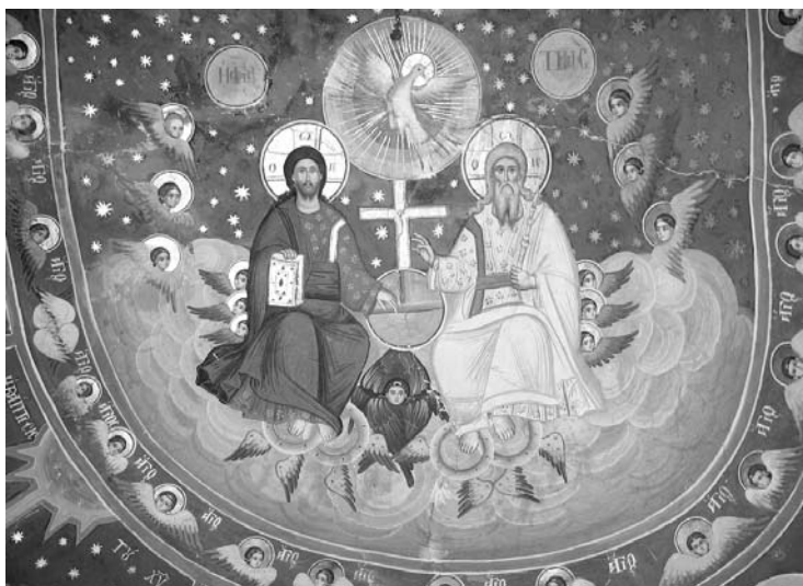
Εἰκ. 15. Παρεκκλήσι Ἁγίου Ἰωάννου τοῦ Θεολόγου. Ἐσωτερικό. Ἱερὸ Βῆμα. Ὀροφή. Τοιχογραφία τῆς Ἁγίας Τριάδος, 1777.