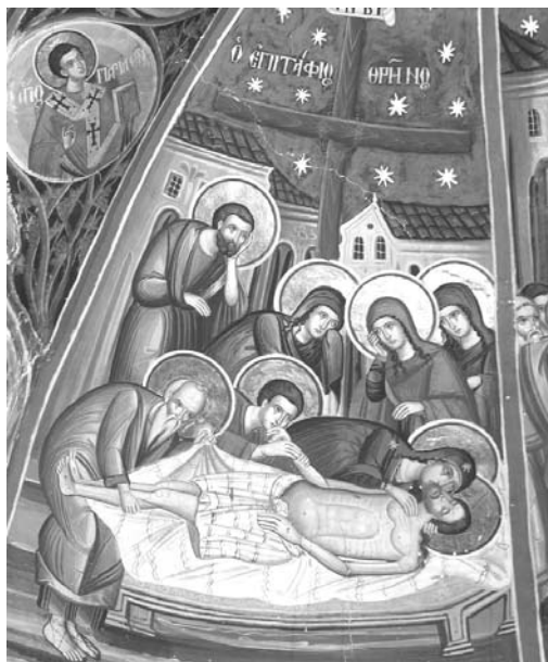
Εἰκ. 12. Παρεκκλήσι Ἁγίου Ἰωάννου τοῦ Θεολόγου. Ἐσωτερικό. Βόρειο τόξο. Τοιχογραφία τοῦ Ἐπιταφίου Θρήνου. 1777.