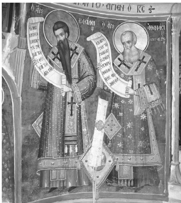
Εἰκ. 16. Παρεκκλήσι Ἁγίου Ἰωάννου τοῦ Θεολόγου. Ἐσωτερικό. Ἱερὸ Βῆμα. Τοιχογραφία μετὰ τοὺς συλλειτουργοῦντες ἱεράρχες ἁγίους Βασίλειο καὶ Ἀθανάσιο Ἀλεξανδρείας, 1777.