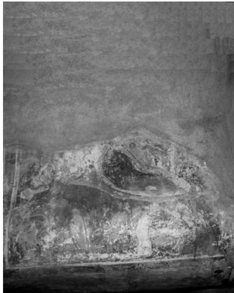
Εἰκ. 2. Παρεκκλήσι Ὑπαπαντῆς τοῦ Σωτήρος Κελίου Ἁγίου Νείλου. Ἐσωτερικό. Τοιχογραφία τῆς Γεννήσεως τοῦ Χριστοῦ.