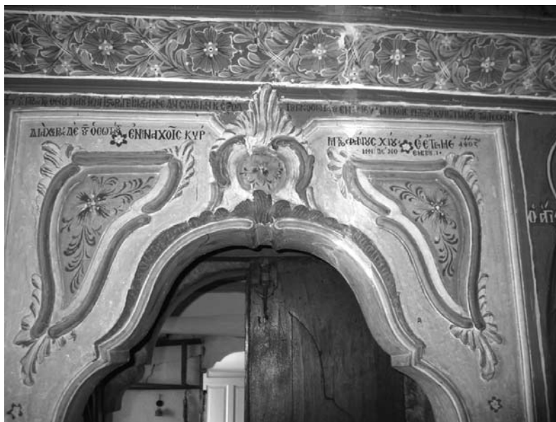
Εἰκ. 5. Παρεκκλήσι Ἁγίου Ἰωάννου τοῦ Θεολόγου. Ἐσωτερικό. Δυτικὴ εἴσοδος. Ὑπέρθυρη κτιτορικὴ ἐπιγραφή. 1777.