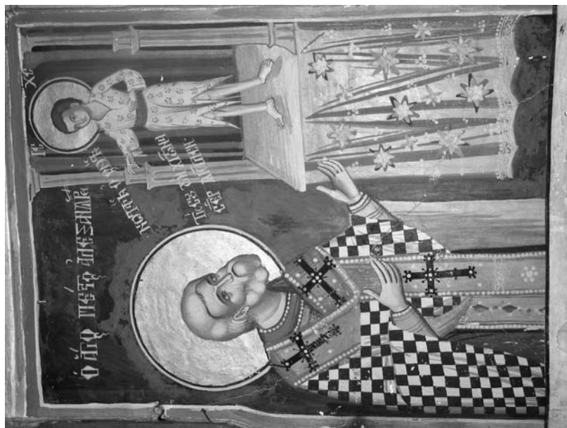
Εἰκ. 18. Παρεκκλήσι Ἁγίου Ἰωάννου τοῦ Θεολόγου. Ἑσωτερικό. Ἱερό Βῆμα. Βόρεια πλευρά. Τοιχογραφία μέ τὸ ὄραμα τοῦ ἁγίου Πέτρου Ἀλεξανδρείας. 1777.