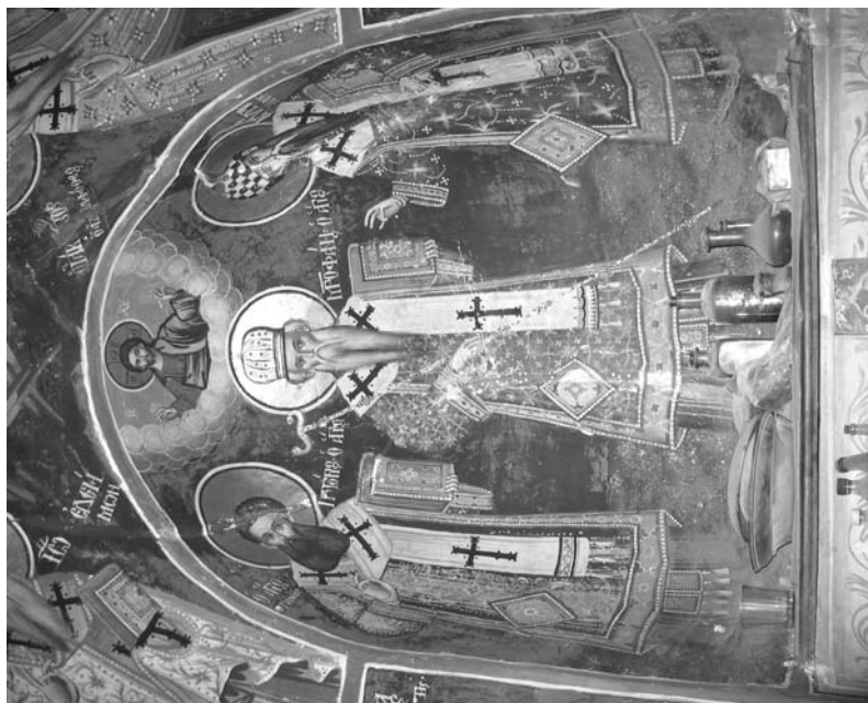
Εἰκ. 20. Παρεκκλήσι Ἁγίου Ἰωάννου τοῦ Θεολόγου. Ἑσωτερικό. Βόρεια πλευρά. Τοιχογραφία τῶν ἁγίων Γρηγορίου Παλαμά, Μητροπολίτου Κωνσταντινουπόλεως καὶ Κυρίλλου Ἀλεξανδρείας. 1777.