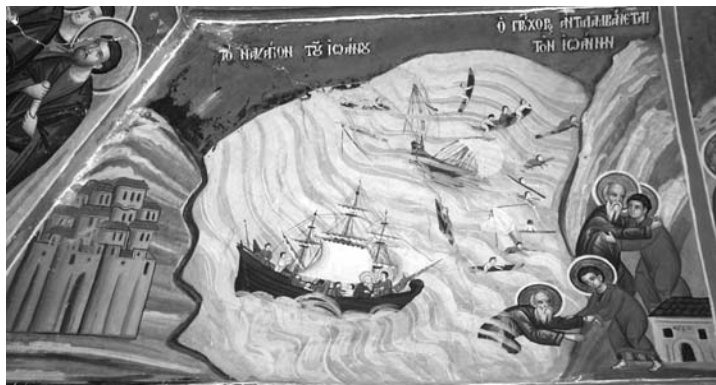
Εἰκ. 7. Παρεκκλήσι Ἁγίου Ἰωάννου τοῦ Θεολόγου. Ἐσωτερικό. Λιτή. Τοιχογραφία μετὸ ναγάιο τοῦ Ἰωάννου. 1777.