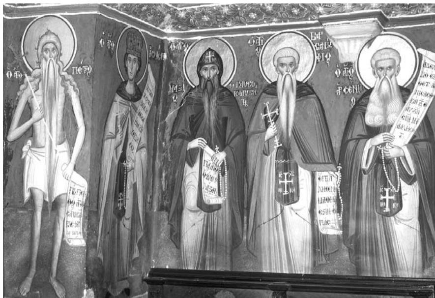
Εικ. 8. Παρεκκλήσι Άγιου Ιωάννου του Θεολόγου. Έσωτερικό. Δυτικός τοίχος. Τοιχογραφία με Όσιους. 1777.