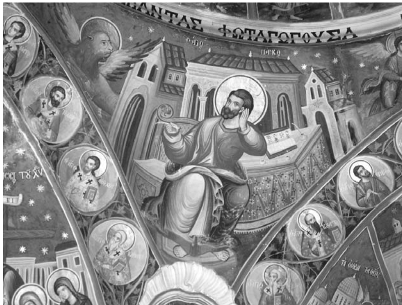
Εἰκ. 11. Παρεκκλήσι Ἁγίου Ἰωάννου τοῦ Θεολόγου. Ἐσωτερικό. Ὁ Εὐαγγελιστὴς Μάρκος καὶ Ἅγιοι Ἀπόστολοι ἐκ τῶν Ἑβδομήκοντα. Τοιχογραφία στὸ ΒΔ λοφίο τοῦ τροῦλου. 1777.