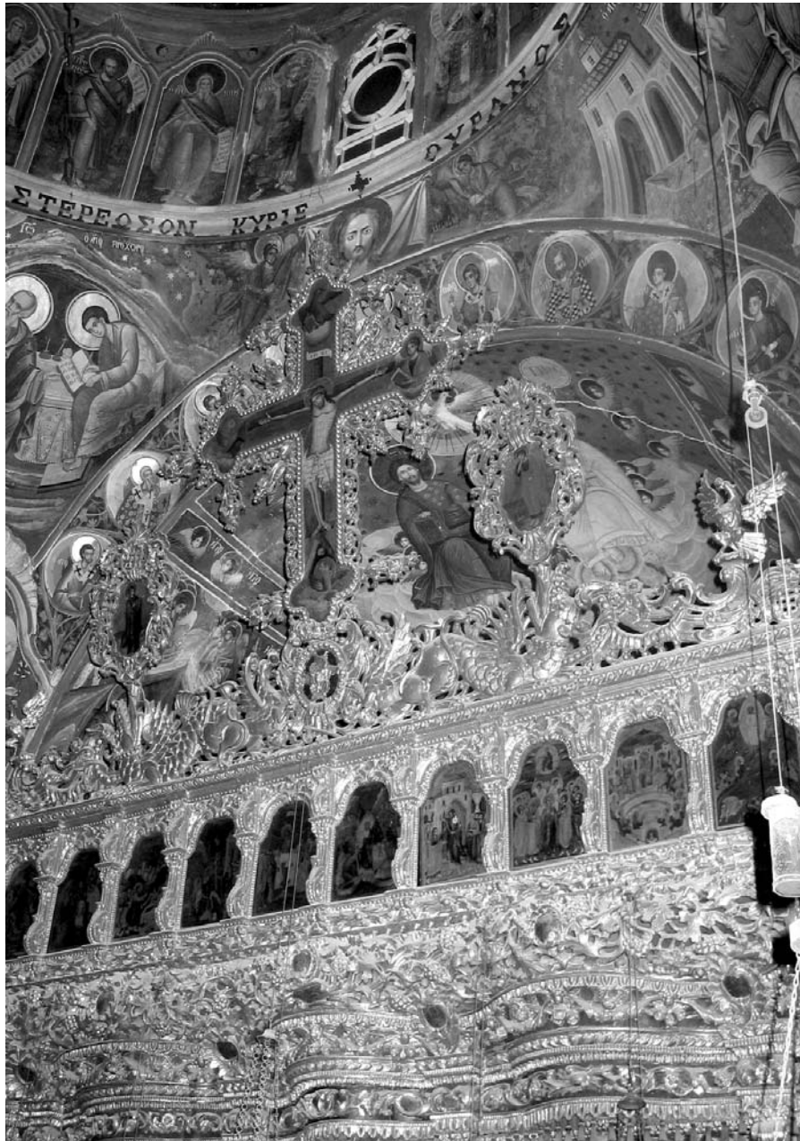
Εἰκ. 14. Παρεκκλήσι Ἁγίου Ἰωάννου τοῦ Θεολόγου. Ἐσωτερικό. Τμήμα τοῦ ξυλόγλυπτον τέμπλον με τὸν Ἐσανρωμένο, τὰ λυπηρὰ καὶ τμήμα τοῦ Δωδεκακόστου.