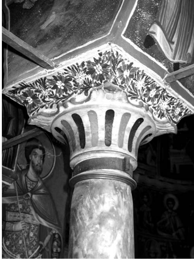
Εἰκ. 6. Παρεκκλήσι Ἁγίου Ἰωάννου τοῦ Θεολόγου. Ἐσωτερικό. Ἐπιζωγραφισμένος κίονας.