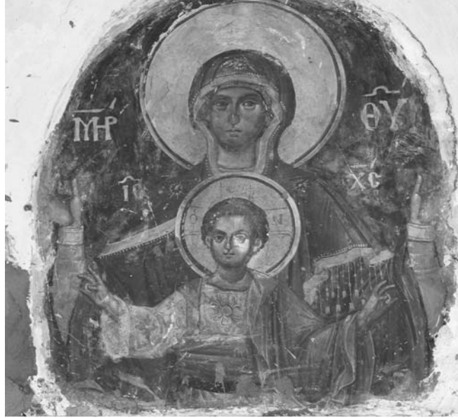
Εἰκ. 21. Παρεκκλήσι Ἁγίου Μαξίμου. Ἐσωτερικό. Ἱερὸ Βῆμα. Τοιχογραφία τῆς Πλατυτέρας τῶν Οὐρανῶν.