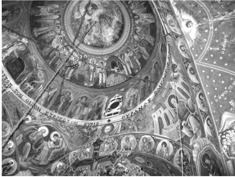
Εἰκ. 10. Παρεκκλήσι Ἁγίου Ἰωάννου τοῦ Θεολόγου. Ἐσωτερικό. Τοιχογραφίες στὸν τροῦλο καὶ γύρω ἀπ' αὐτόν. 1777.