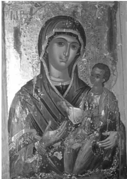
Εἰκ. 1. Παρεκκλήσι Κοιμήσεως Θεοτόκου Κελίου Ἁγίου Νείλου. Φορητὴ εἰκόνα τῆς Θεοτόκου Ὁδηγητρίας.