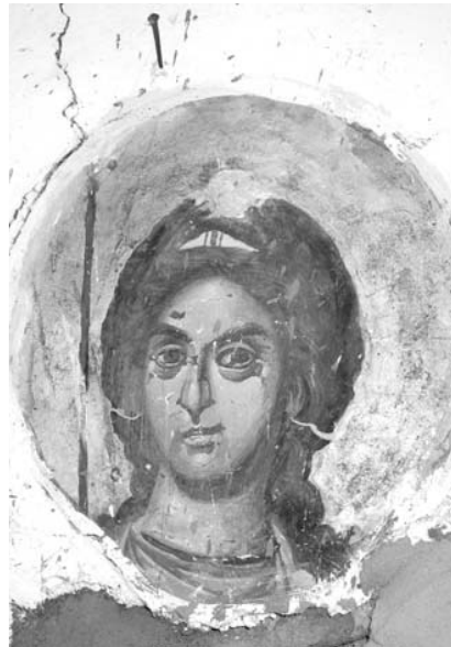
Εἰκ. 23. Παρεκκλήσι Ἁγίου Μαξίμου. Ἐσωτερικό. Ἱερὸ Βῆμα. Τοιχογραφία (σπάραγμα) ἀγγέλου Β΄.