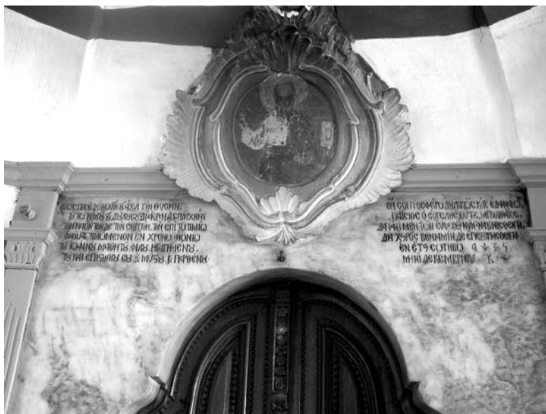
Εἰκ. 4. Παρεκκλήσι Ἁγίου Ἰωάννου τοῦ Θεολόγου. Δυτικὴ εἴσοδος (ἐξωτερικά). Ὑπέρθυρη κτιτορικὴ ἐπιγραφή. 1766.