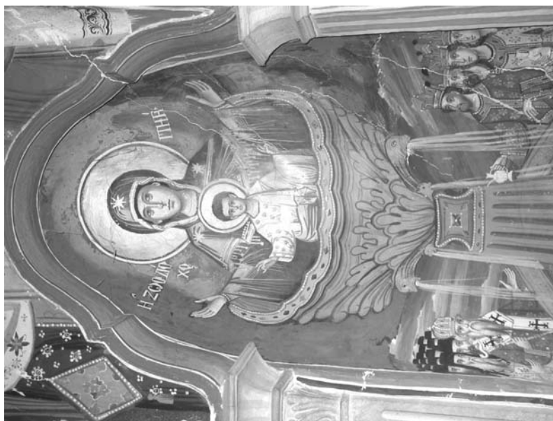
Εἰκ. 19. Παρεκκλήσι Ἁγίου Ἰωάννου τοῦ Θεολόγου. Ἑσωτερικό. Ἱερό Βῆμα. Κόγχη διακονικοῦ. Τοιχογραφία τῆς Ζωοδόχου Πηγῆς. 1777.