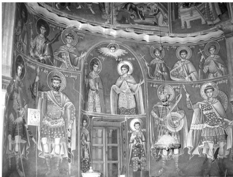
Εἰκ. 13. Παρεκκλήσι Ἁγίου Ἰωάννου τοῦ Θεολόγου. Ἐσωτερικό. Βόρειος τοῖχος. Τοιχογραφία Ἁγίων Μαρτύρων. 1777.