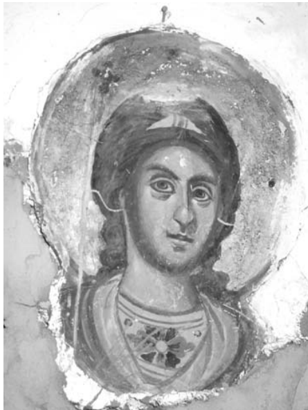
Εἰκ. 22. Παρεκκλήσι Ἁγίου Μαξίμου. Ἐσωτερικό. Ἱερὸ Βῆμα. Τοιχογραφία (σπάραγμα) ἀγγέλου Α΄.