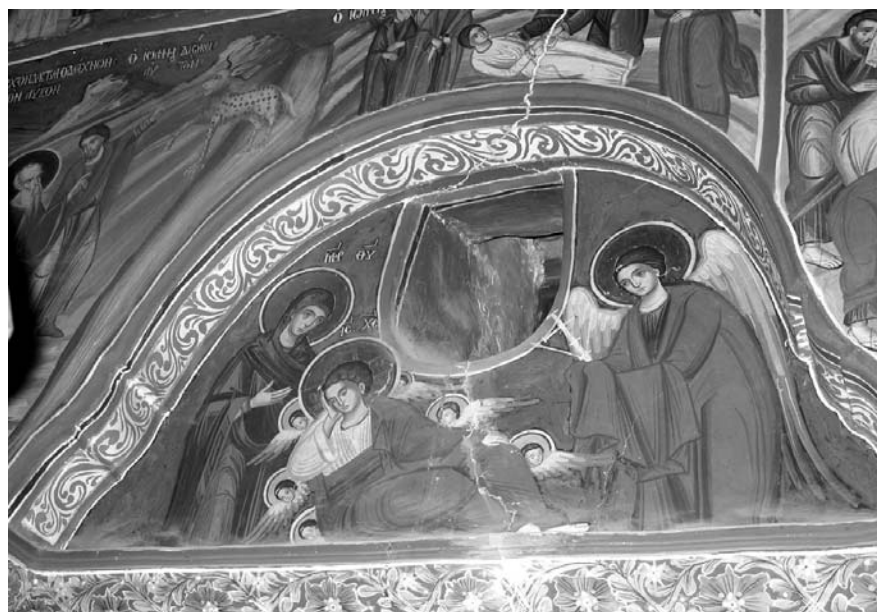
Εικ. 9. Παρεκκλήσι Άγιου Ιωάννου του Θεολόγου. Έσωτερικό. Κυρίως ναός. Τοιχογραφία πάνω από τη δυτική πύλη με τον Άναπεσόντα Κύριο. 1777.