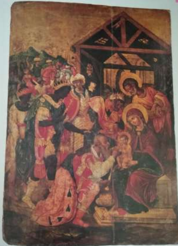
12. Η ΠΙΣΤΟΚΥΝΗΣΗ ΤΩΝ ΜΑΓΩΝ Ζωγράφος: Βαρσοβική Σχολή, 1667 Διαμ. 43x40 εκ.