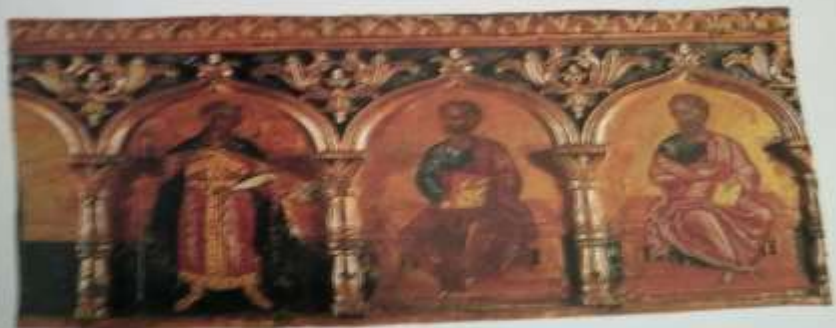
69. ΤΕΤΡΑΜΑΤΑ ΑΠΟ ΕΠΙΣΤΥΜΟ ΤΕΜΙΣΟΥ Πάρισις, 17ος αι. Διαμ. α. 46 x 213 εκ. β. 46 x 91 εκ. γ. 46 x 91 εκ.