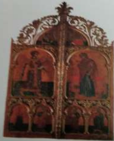
68. ΒΙΣΚΟΝΤΟ ΚΑΙ ΤΣΙΜΜΑΤΑ ΕΠΙΣΤΥΛΟΥ ΤΥΜΠΛΟΥ Πάρισις, 1768, 98. Συν. 1431, 749.