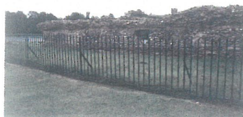
Άπό τά ερείπια τοῦ Βερουλάμιουμ.