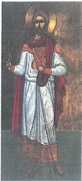
Ἡ βυζαντινὴ εἰκόνα τοῦ Ἁγίου.

Εἶναι τόσο κοντά στό Λονδίνο, κι ὅμως, γιά νά μπορέσει νά τό διακρίνει ὁ νεοέλληνας ἐπισκέπτης τῆς βρετανικῆς πρωτεύουσας, θά χρειαστεῖ ματιά πού νά μή μένει στή λάμψη τῆς Μαντάμ Τυσσά καί τῆς Καρυάτιδας· πόσο μᾶλλον στά καταστήματα τῆς Ὁξφορντ Στρήτ! Πρόκειται, ἐν τούτοις, γιά ἕναν τόπο πού δέχεται ἐπισκέπτες καί προσκυνητές ἐπί δεκαεπτὰ σχεδόν αἰῶνες ἀδιάκοπα!